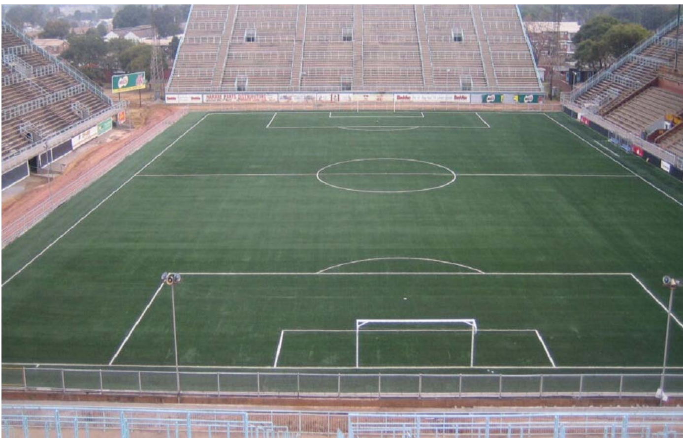
Bereit für die Wiederaufnahme des Fussballbetriebs, gespielt auf FIFA-geprüftem Kunstrasen.