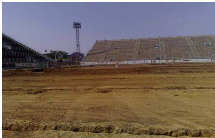
Tiefgreifende Arbeiten am Fundament.