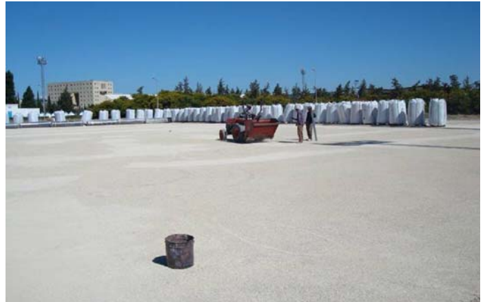
Vorbereiten des Untergrundes.

Mehr Information über "Gewinnen in Afrika mit Afrika": http://de.fifa.com/mm/goalproject/WinAF_D.pdf