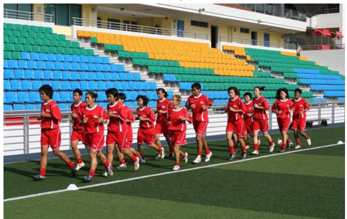
Warm-up während eines Coaching-Lehrgangs in Singapur