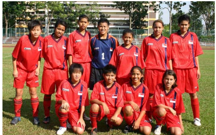
Das U-17-Frauen-Nationalteam von Singapur

Es war mehr als ein Schlagwort, als der FIFA-Präsident 1995 den Begriff „Die Zukunft ist weiblich“ prägte - es steht die tiefe Überzeugung dahinter, dass im Frauenfußball ein riesiges Entwicklungspotenzial steckt. Seit diesen Tagen unterstützt die FIFA gezielt Bestrebungen von Verbänden, die den Frauen die gleichen Entwicklungsmöglichkeiten wie den männlichen Akteuren bieten wollen. Seit der Einführung des Programms Finanzielle Unterstützung der FIFA (FAP) 1998 sind die Verbände und Konföderationen verpflichtet, in den Frauenfußball zu investieren, seit 2004 vier, seit 2005 sogar zehn Prozent der bezogenen Summen. Dies geschieht neben der allgemeinen Förderung durch die direkte Finanzierung des Spielbetriebs sowie durch die Organisation von Wettbewerben und Symposien. Die FIFA spielt mit ihren Entwicklungsprogrammen eine aktive Rolle bei der Schulung in den Bereichen Administration, Training, Schiedsrichterwesen und Sportmedizin.