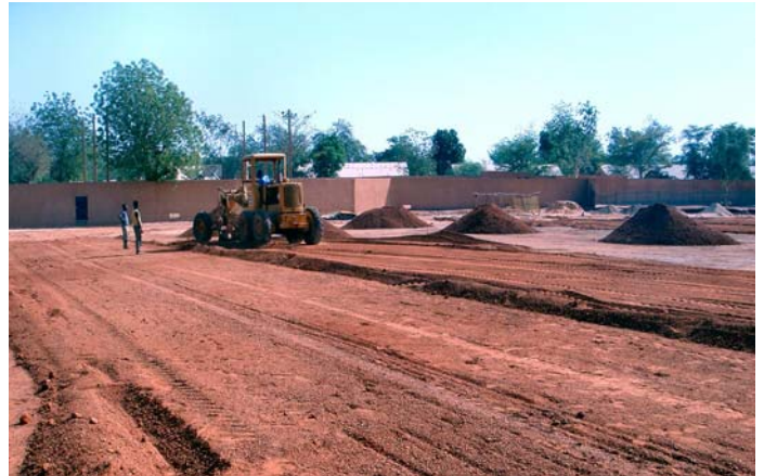
Intensive Arbeiten am Untergrund im städtischen Stadion im Rahmen des Programms Gewinnen in Afrika mit Afrika.