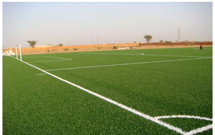
Ein weiteres Kunstrasenfeld wurde im technischen Zentrum in Niamey installiert - dies als Teil des dortigen Goal-Projekts.