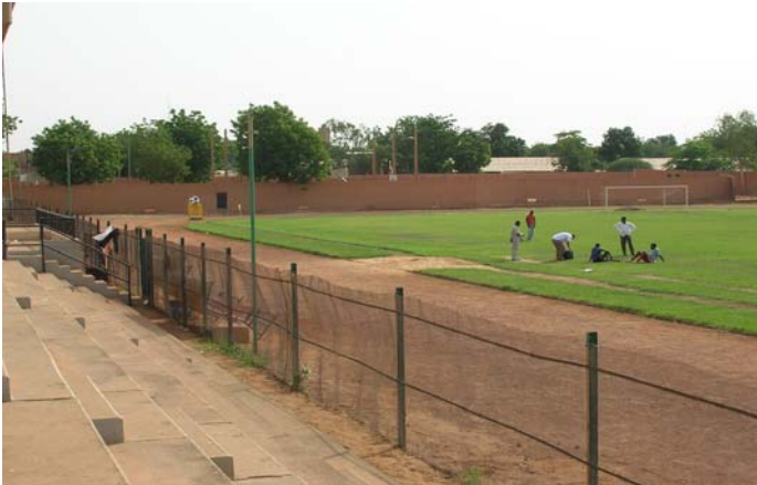
Ärmliche Verhältnisse im städtischen Stadion von Niamey führten zum Wunsch nach einem allwettertauglichen Kunstrasen.

Mehr Information über "Gewinnen in Afrika mit Afrika": http://de.fifa.com/mm/goalproject/WinAF_D.pdf