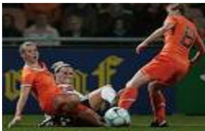
Das Frauen-Nationalteam der Niederlande