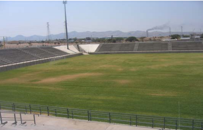
Das San-Nujoma-Stadion in Kauturo, Windhoek, mit erholungsbedürftigem Gras-Spielfeld.

Mehr Information über "Gewinnen in Afrika mit Afrika": http://de.fifa.com/mm/goalproject/WinAF_D.pdf