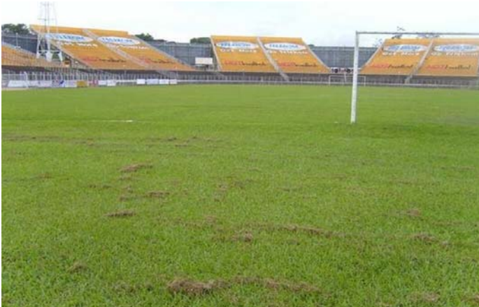
Naturrasenfeld im Kamuzu-Stadion in Blantyre. Kapazität: 40 000 Zuschauer.

Mehr Information über "Gewinnen in Afrika mit Afrika": http://de.fifa.com/mm/goalproject/WinAF_D.pdf