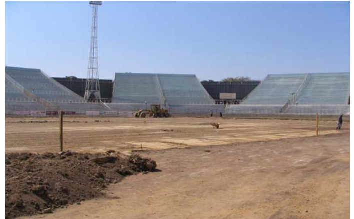
Umfangreiche Erdbewegungen waren nötig für einen korrekten Untergrund für ein Kunstrasenfeld.