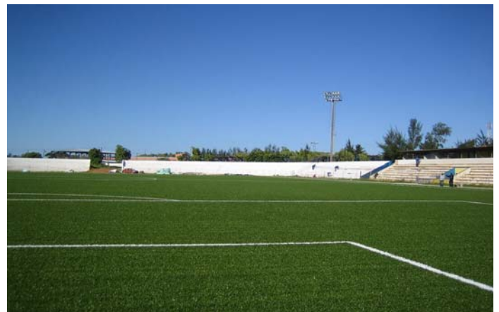
Die Gesamtkosten wurden je zur Hälfte getragen von der FIFA und der mosambikanischen Regierung.