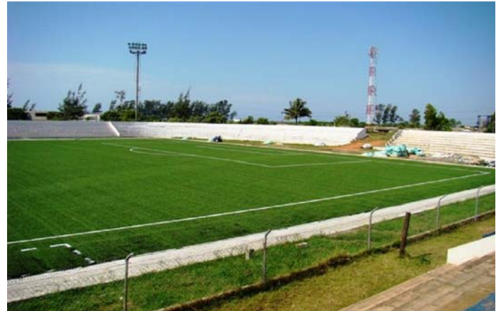
Das Machava-Stadion uneingeschränkt einsatzbereit.