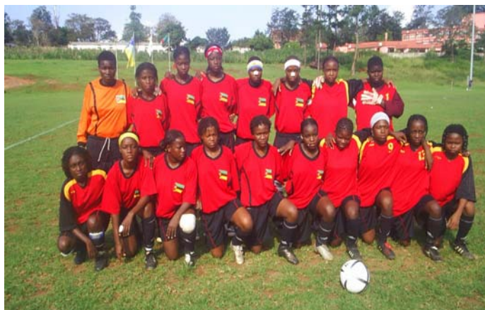
Das U-20-Frauen-Nationalteam von Mosambik

Es war mehr als ein Schlagwort, als der FIFA-Präsident 1995 den Begriff „Die Zukunft ist weiblich“ prägte - es steht die tiefe Überzeugung dahinter, dass im Frauenfußball ein riesiges Entwicklungspotenzial steckt. Seit diesen Tagen unterstützt die FIFA gezielt Bestrebungen von Verbänden, die den Frauen die gleichen Entwicklungsmöglichkeiten wie den männlichen Akteuren bieten wollen. Seit der Einführung des Programms Finanzielle Unterstützung der FIFA (FAP) 1998 sind die Verbände und Konföderationen verpflichtet, in den Frauenfußball zu investieren, seit 2004 vier, seit 2005 sogar zehn Prozent der bezogenen Summen. Dies geschieht neben der allgemeinen Förderung durch die direkte Finanzierung des Spielbetriebs sowie durch die Organisation von Wettbewerben und Symposien. Die FIFA spielt mit ihren Entwicklungsprogrammen eine aktive Rolle bei der Schulung in den Bereichen Administration, Training, Schiedsrichterwesen und Sportmedizin.