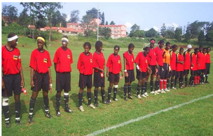
Aufstellung vor Beginn des Spiels gegen Russland