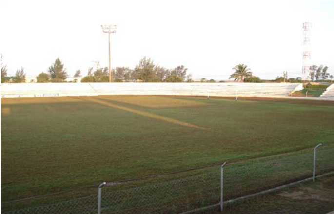
Estadio da Machava - der eine der beiden Orte, wo FIFA-homologierte Kunstrasenfelder installiert wurden.

Mehr Information über "Gewinnen in Afrika mit Afrika": http://de.fifa.com/mm/goalproject/WinAF_D.pdf