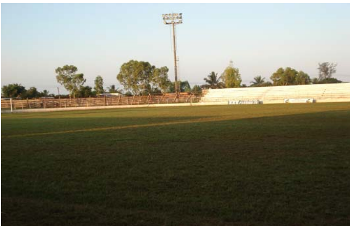
Der andere Fussball-Ort: Clube de Desportos Costa do Sol.