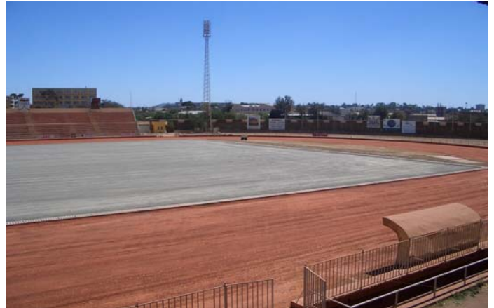
Vorbereiten des Untergrundes.