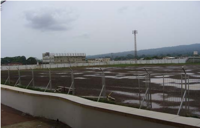
Estadio La Paz, Malabo

Mehr Information über "Gewinnen in Afrika mit Afrika": http://de.fifa.com/mm/goalproject/WinAF_D.pdf