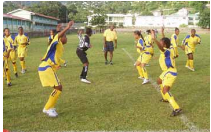
Fussballtraining oder Jazz dance?

Es war mehr als ein Schlagwort, als der FIFA-Präsident 1995 den Begriff „Die Zukunft ist weiblich“ prägte - es steht die tiefe Überzeugung dahinter, dass im Frauenfußball ein riesiges Entwicklungspotenzial steckt. Seit diesen Tagen unterstützt die FIFA gezielt Bestrebungen von Verbänden, die den Frauen die gleichen Entwicklungsmöglichkeiten wie den männlichen Akteuren bieten wollen. Seit der Einführung des Programms Finanzielle Unterstützung der FIFA (FAP) 1998 sind die Verbände und Konföderationen verpflichtet, in den Frauenfußball zu investieren, seit 2004 vier, seit 2005 sogar zehn Prozent der bezogenen Summen. Dies geschieht neben der allgemeinen Förderung durch die direkte Finanzierung des Spielbetriebs sowie durch die Organisation von Wettbewerben und Symposien. Die FIFA spielt mit ihren Entwicklungsprogrammen eine aktive Rolle bei der Schulung in den Bereichen Administration, Training, Schiedsrichterwesen und Sportmedizin.