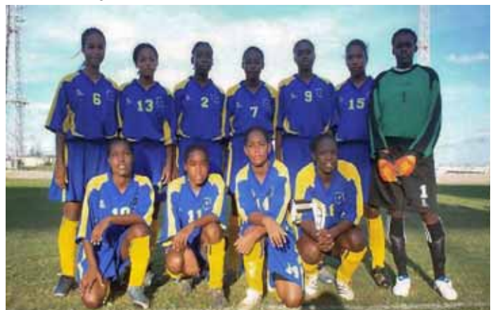
Die Frauen-Nationalmannschaft Barbados