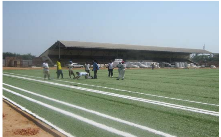
Eindruck vom Ausmass der Renovationsarbeiten.