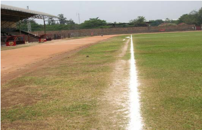
Das Stadion Prince Louis Rwagasore vor der Erneuerung der Spielfläche.

Mehr Information über "Gewinnen in Afrika mit Afrika": http://de.fifa.com/mm/goalproject/WinAF_D.pdf