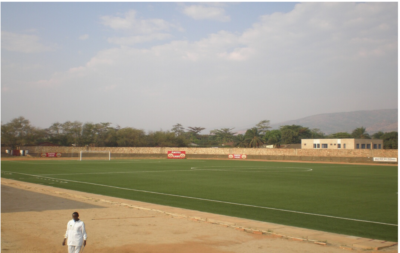
Auf dem neuen Kunstrasenfeld fand im August 2007 das CECAFA U-17-Turnier mit acht Mannschaften statt.