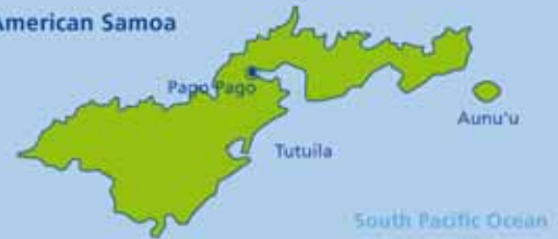
South Pacific Ocean