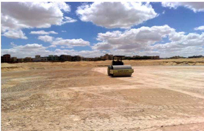
Training centre in 6 October City, Giza

Mehr Information über "Gewinnen in Afrika mit Afrika": http://de.fifa.com/mm/goalproject/WinAF_D.pdf