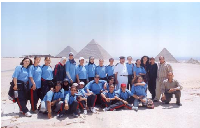
Ägyptische Frauenfußball-Instruktorinnen in der Ausbildung