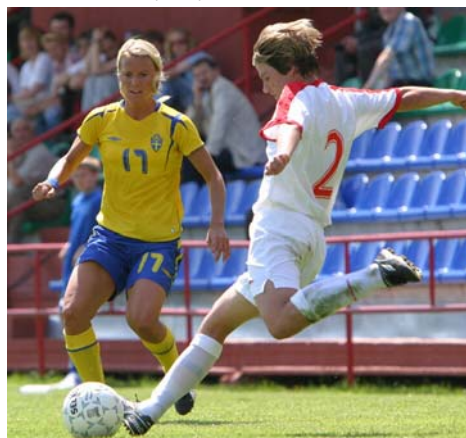
Länderspiel gegen Schweden