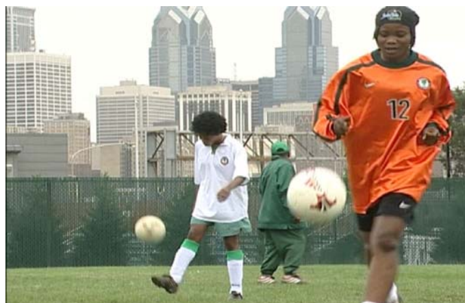
Trainingseinheit auf dem Dach eines Hauses in Algier

Es war mehr als ein Schlagwort, als der FIFA-Präsident 1995 den Begriff „Die Zukunft ist weiblich“ prägte - es steht die tiefe Überzeugung dahinter, dass im Frauenfußball ein riesiges Entwicklungspotenzial steckt. Seit diesen Tagen unterstützt die FIFA gezielt Bestrebungen von Verbänden, die den Frauen die gleichen Entwicklungsmöglichkeiten wie den männlichen Akteuren bieten wollen. Seit der Einführung des Programms Finanzielle Unterstützung der FIFA (FAP) 1998 sind die Verbände und Konföderationen verpflichtet, in den Frauenfußball zu investieren, seit 2004 vier, seit 2005 sogar zehn Prozent der bezogenen Summen. Dies geschieht neben der allgemeinen Förderung durch die direkte Finanzierung des Spielbetriebs sowie durch die Organisation von Wettbewerben und Symposien. Die FIFA spielt mit ihren Entwicklungsprogrammen eine aktive Rolle bei der Schulung in den Bereichen Administration, Training, Schiedsrichterwesen und Sportmedizin.