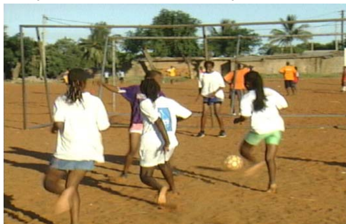
Trainingseinheit auf typischer Oberfläche eines heißen Landes